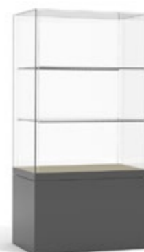
H 14 avec étagères