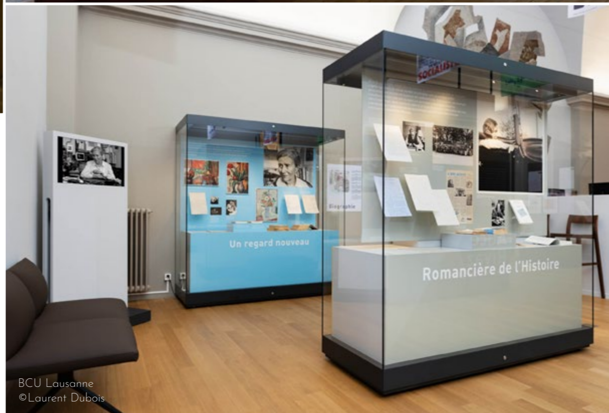
BCU Lausanne ©Laurent Dubois