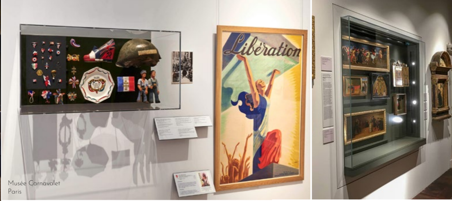
Musée Carnavalet Paris

Notre gamme de vitrines de conservation se décline également en version murale. Deux types d'ouverture sont possibles : un caisson basculant, assisté par vérins à gaz invisibles ou une porte battante.