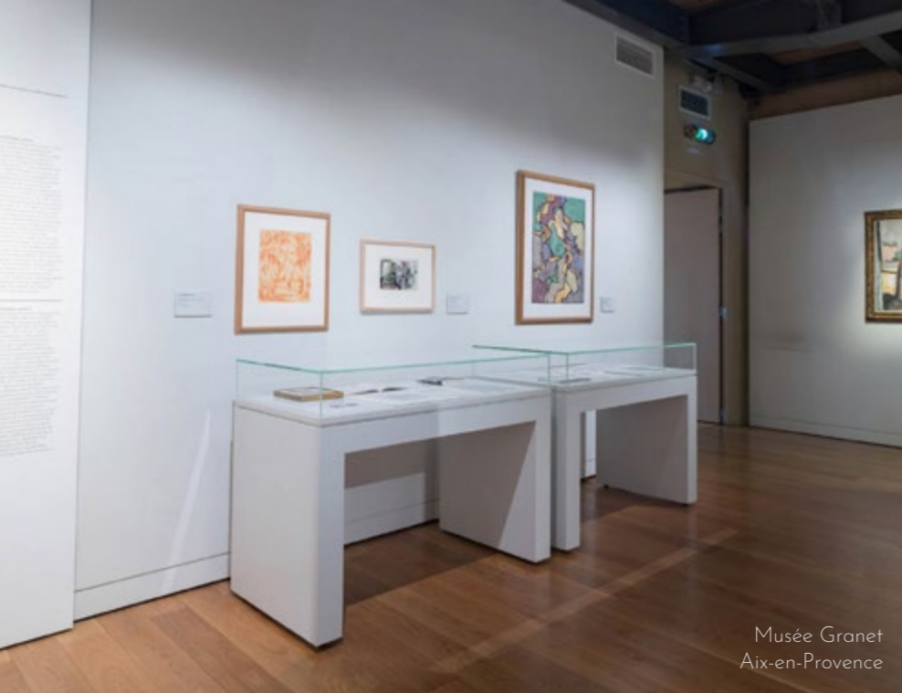
Musée Granet Aix-en-Provence