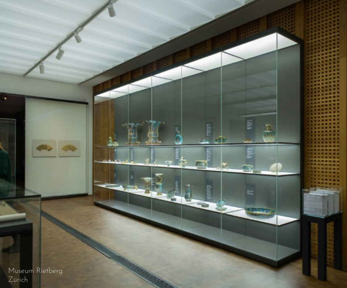
Museum Rietberg Zürich