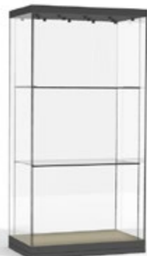
H 12B avec étagères