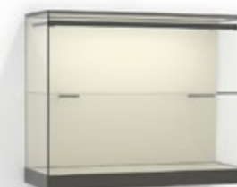
W 52 avec étagère et LED