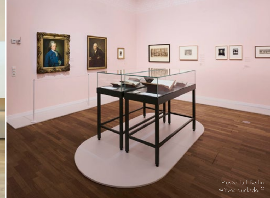
Musée Juif Berlin