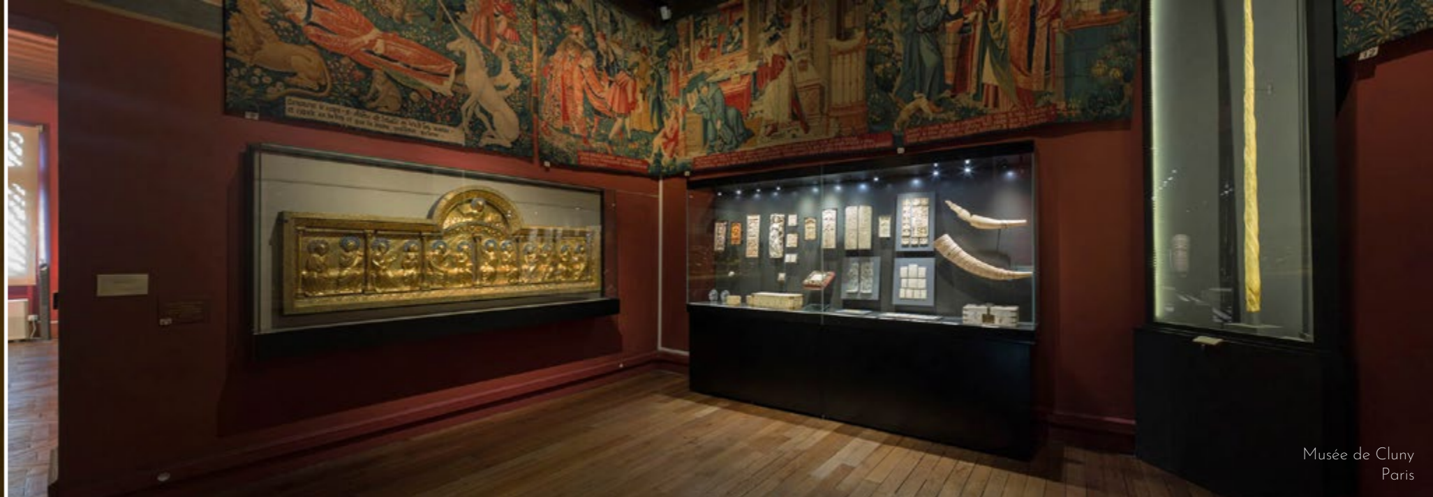
Musée de Cluny Paris