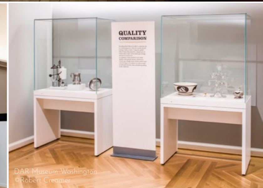
DAR Museum-Washington

Nos vitrines hautes sont conçues pour répondre aux exigences de conservation les plus strictes.