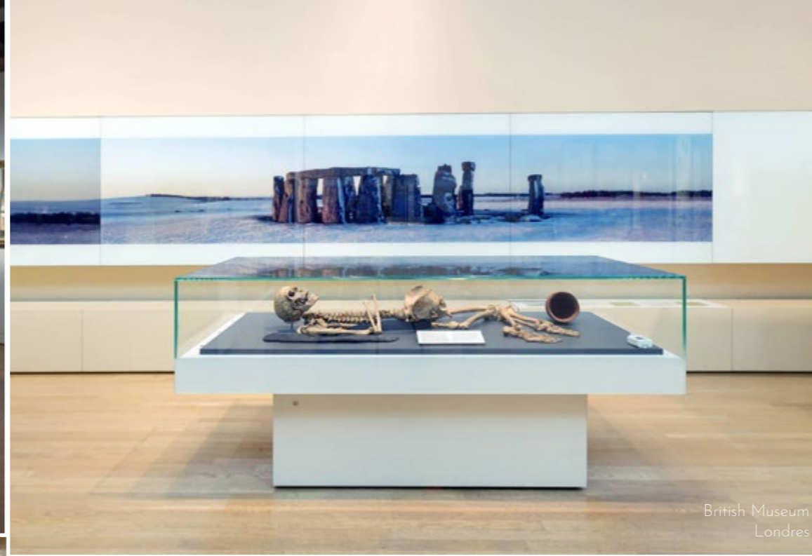
British Museum Londres