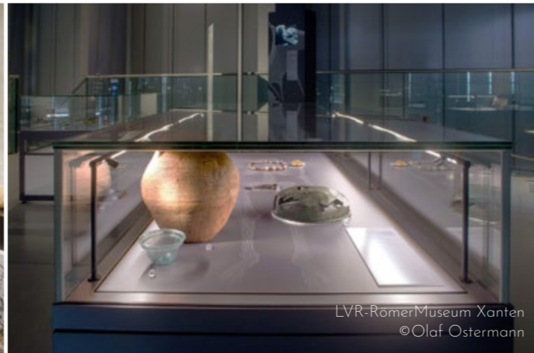
LVR-RömerMuseum Xanten © Olaf Ostermann