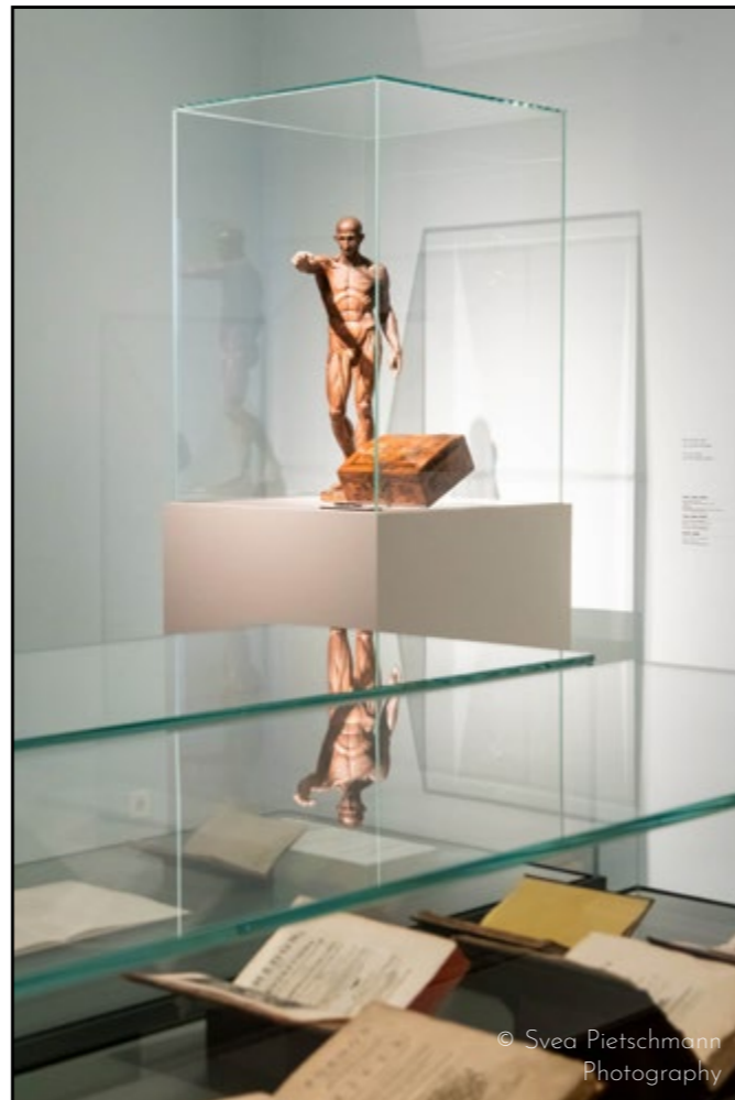
Musée Juif - Berlin

« Les œuvres d'art sont les témoins silencieux de l'histoire, et les vitrines sont leurs gardiennes bienveillantes. »