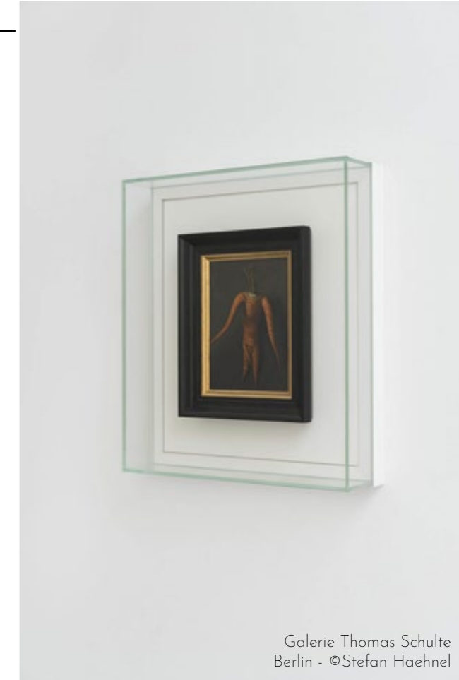
Galerie Thomas Schulte Berlin