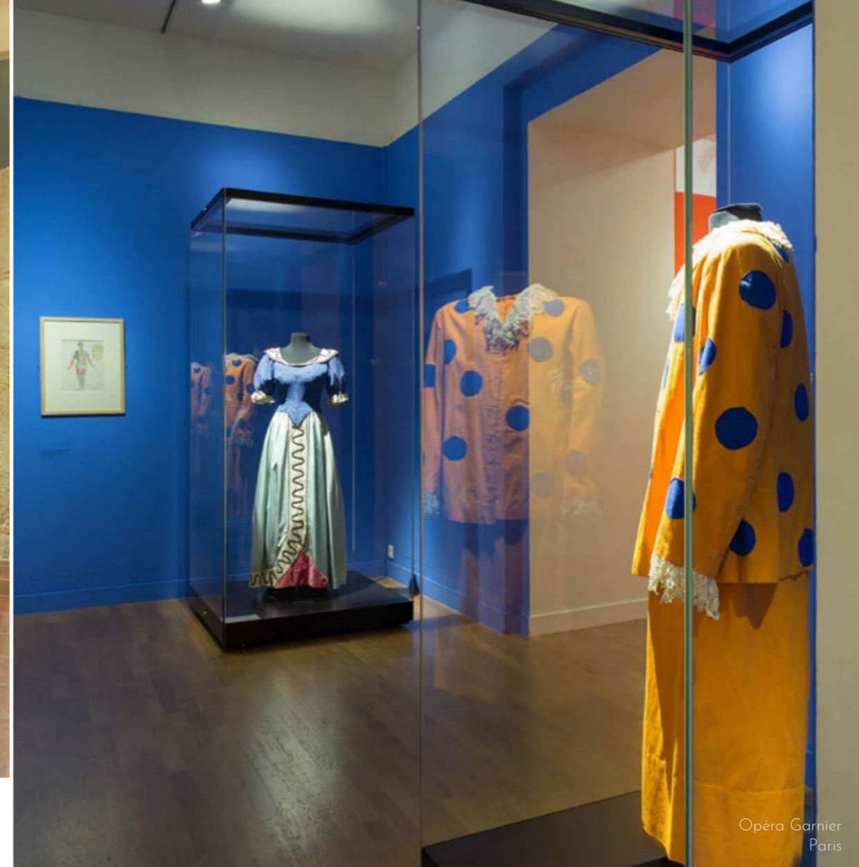
Musée de la Mode Albi