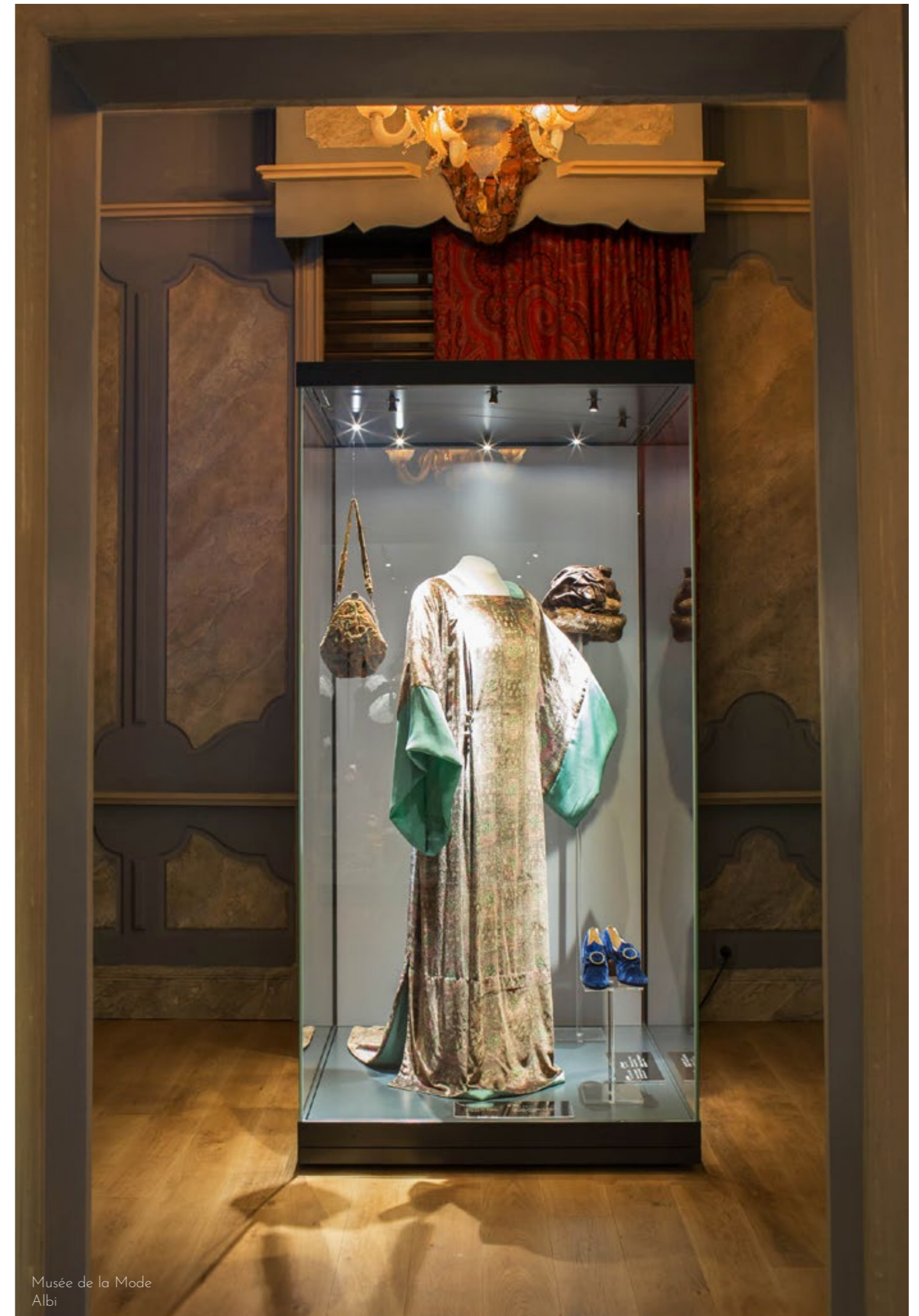
Musée de la Mode Albi

« Les œuvres d'art sont les témoins silencieux de l'histoire, et les vitrines sont leurs gardiennes bienveillantes. »