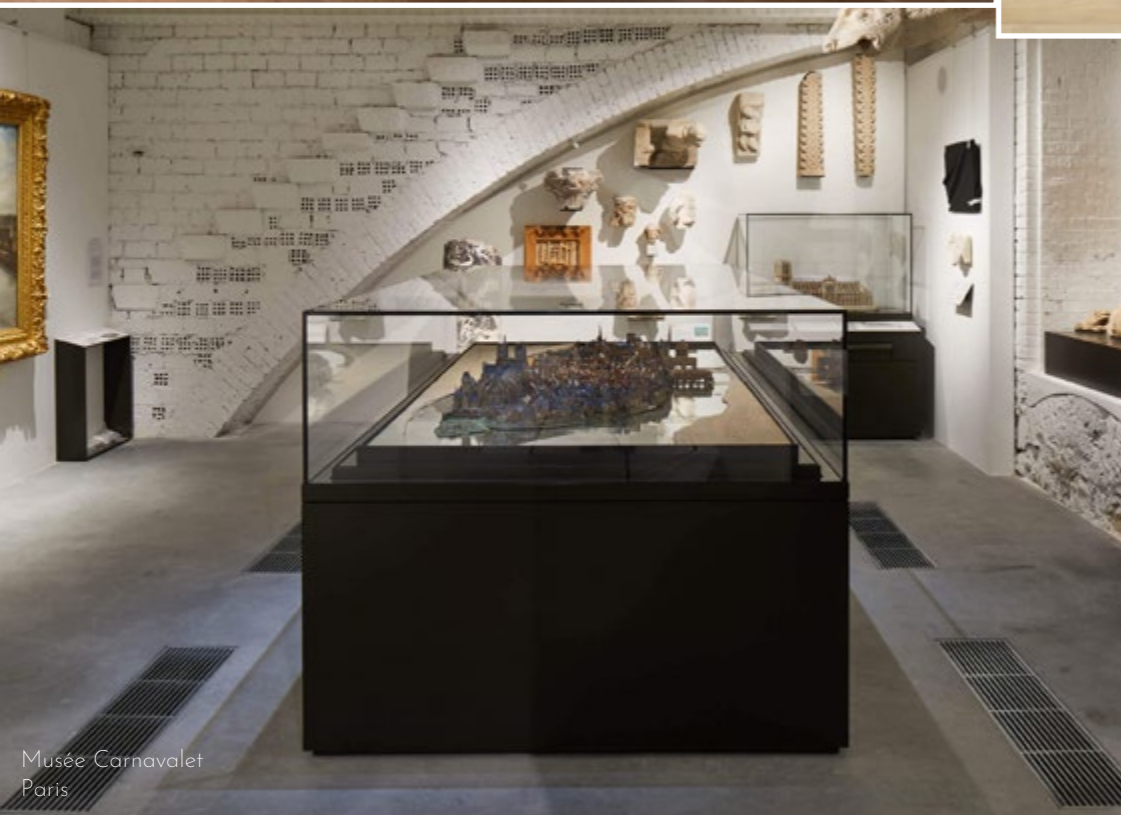
Musée Carnavalet Paris