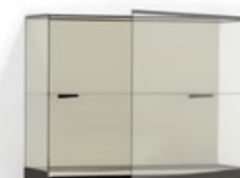
W 52 avec étagère