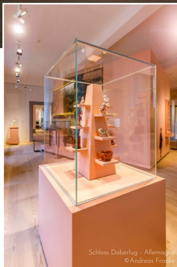
Schloss Doberlug - Allemagne