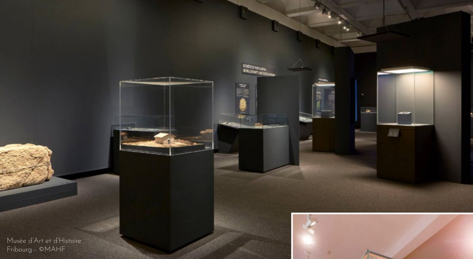
Musée d'Art et d'Histoire Fribourg - ©MAHF

Notre vitrine cloche se décline en plusieurs modèles. Composée d'un vitrage feuilleté extra blanc et d'un socle en tôle laquée parmi un choix de 188 teintes standards, elle est la solution idéale pour mettre en valeur les pièces maîtresses de vos collections.